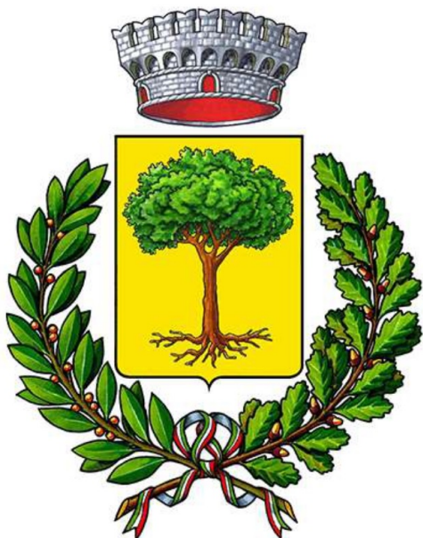
Comune di Cerreto Guidi