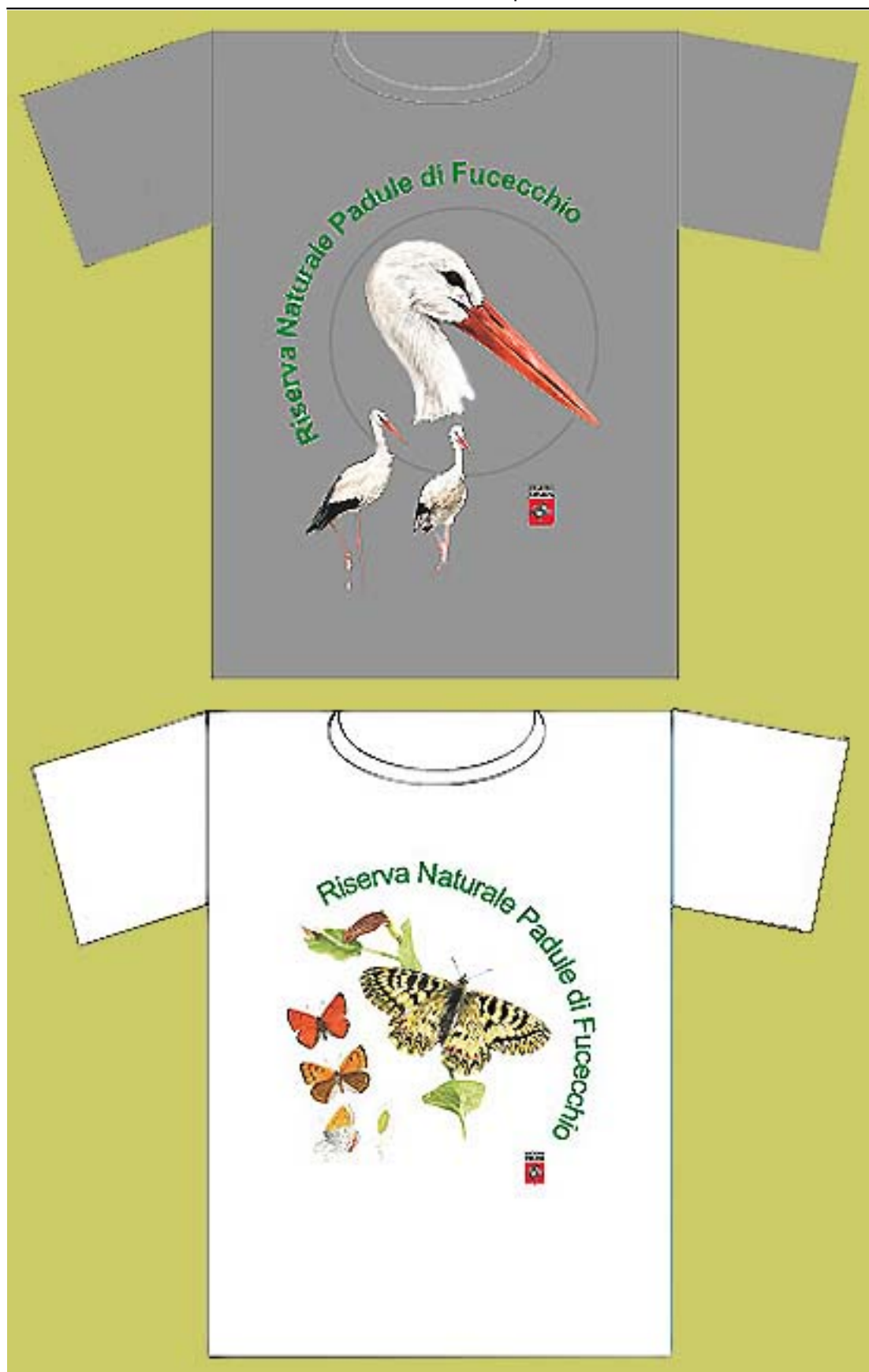
Magliette Riserva Naturale del Padule di Fucecchio taglie adulti Disponibili in varie taglie e nei soggetti "Cicogne" e "Farfalle" (euro 10,00 cadauna)