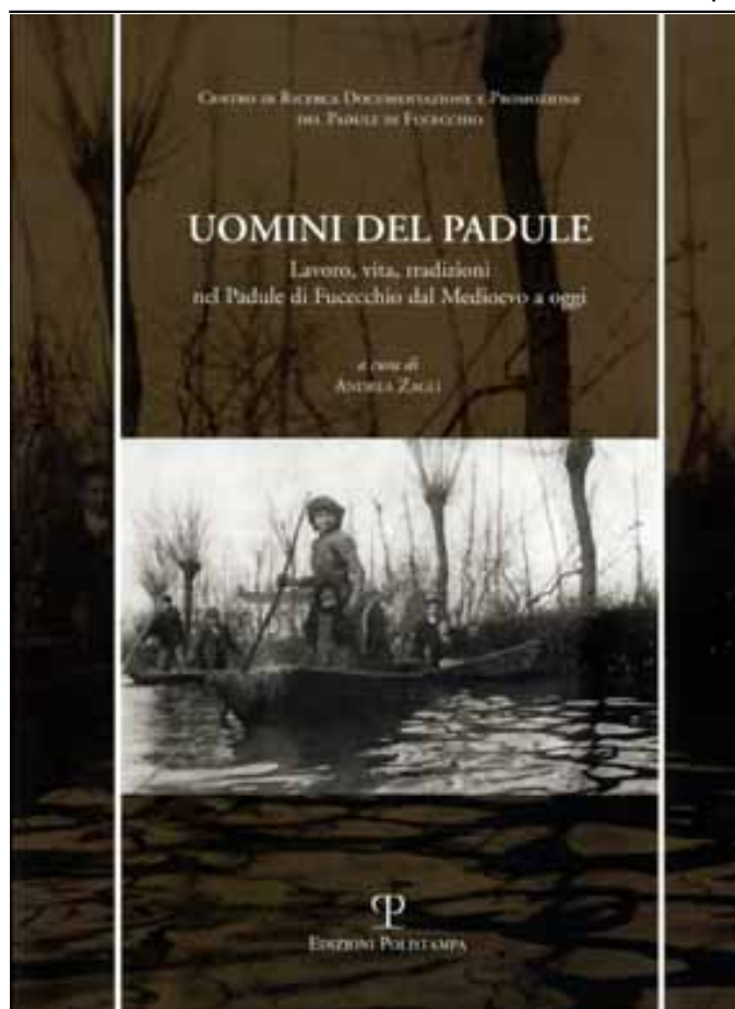
“Uomini del Padule - Lavoro, vita, tradizioni nel Padule di Fucecchio dal Medioevo ad oggi A cura di A.Zagli / Edizioni Polistampa - Centro R.D.P. Padule di Fucecchio 2003 (euro 15,00)