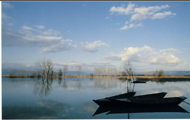
Padule di Fucecchio